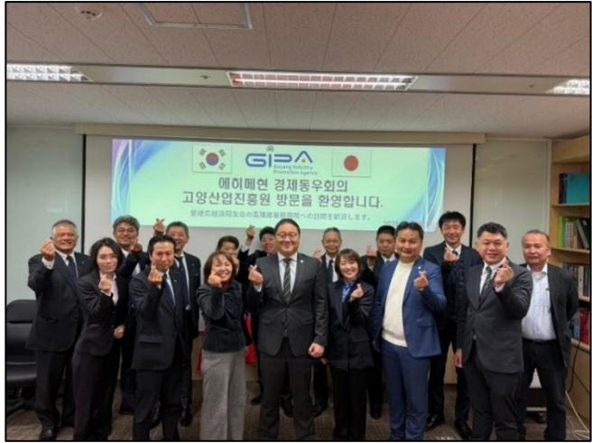
10 : 00 高陽スマートシティ支援センター視察